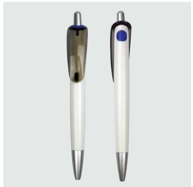
BOL 03 Bolígrafo Warhol