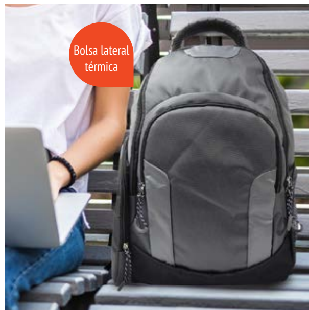
MAL 616 Backpack Sampras