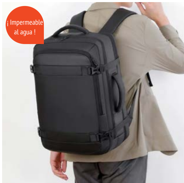
MAL 614 Backpack Ledecky