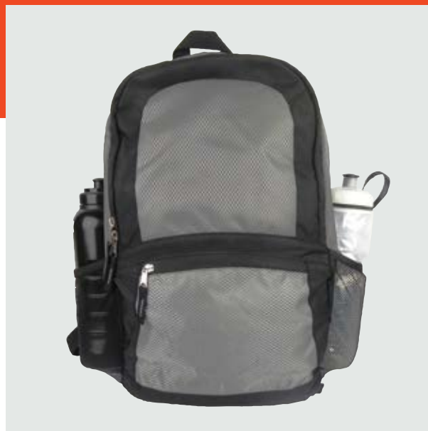
MAL 617 Backpack Lance