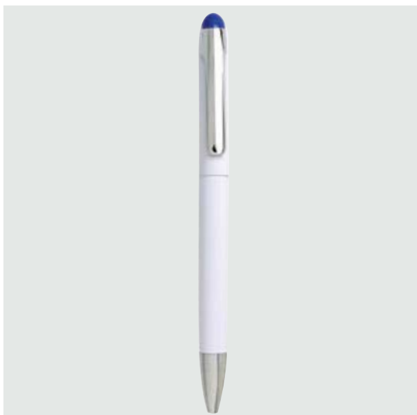
BOL 09 Bolígrafo Luke