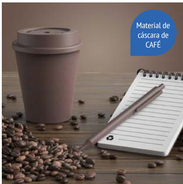
TH 214 Set Coffee Husk