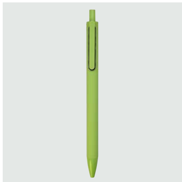
BOL 14 Bolígrafo Angélico