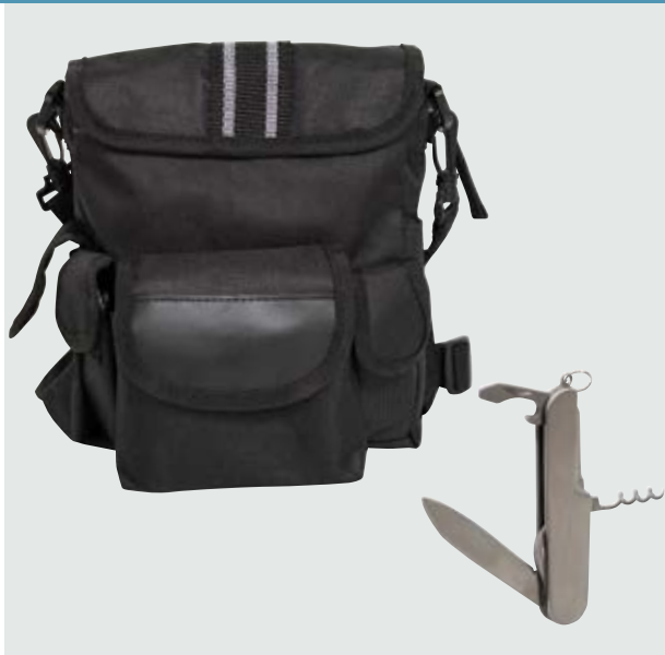
HER 40 Mochila Scout ■