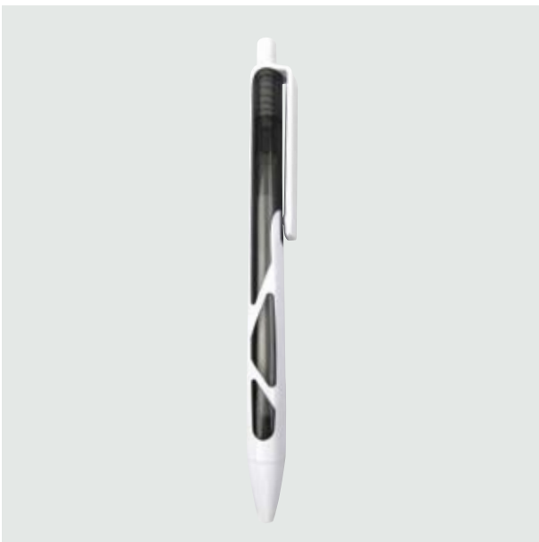
BOL 00 Bolígrafo Hooper