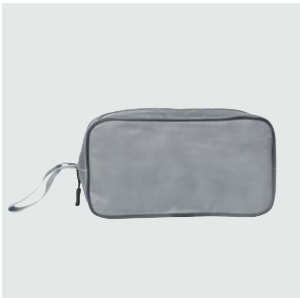
FOR 04 Neceser para Viajes Tíber ■