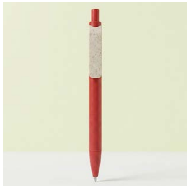
BOL 334 Bolígrafo Quinn