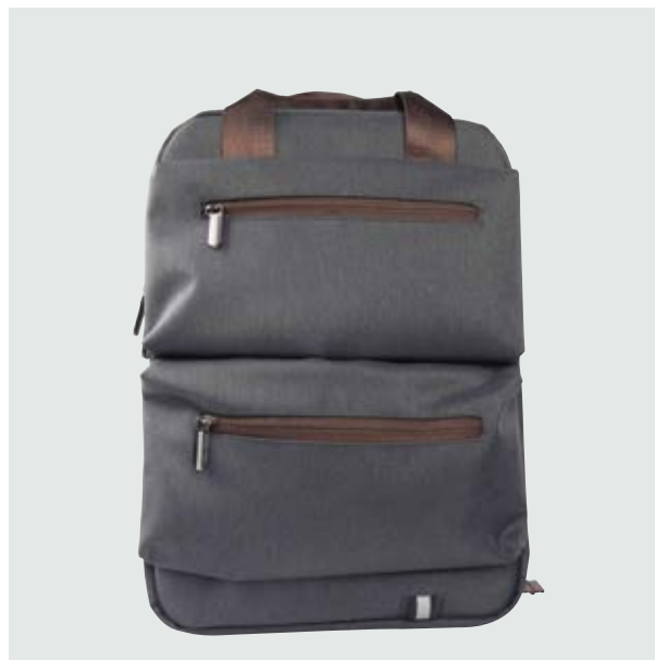
MAL 619 Backpack Roger