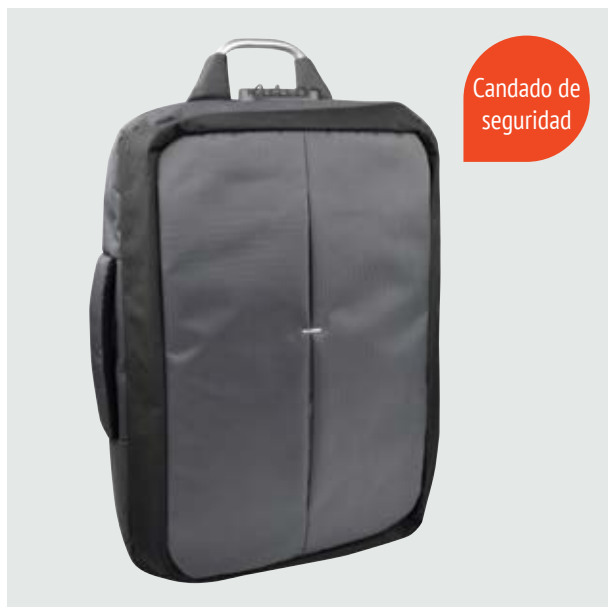
MAL 612 Backpack Tiger