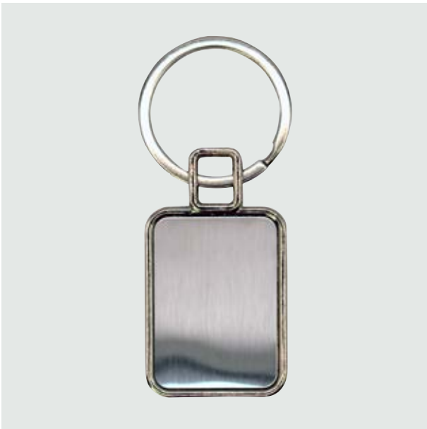
LLA 23 Llavero Cuadrado Plano