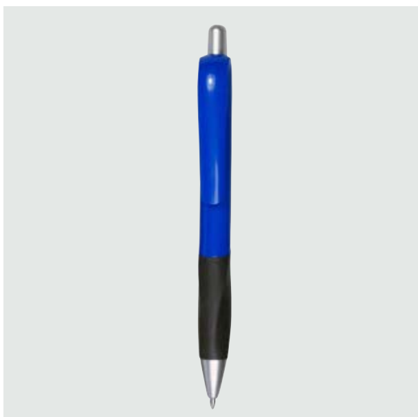
BOL 06 Bolígrafo Fiori