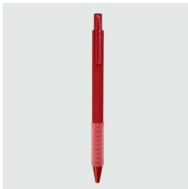
BOL 07 Bolígrafo Homer